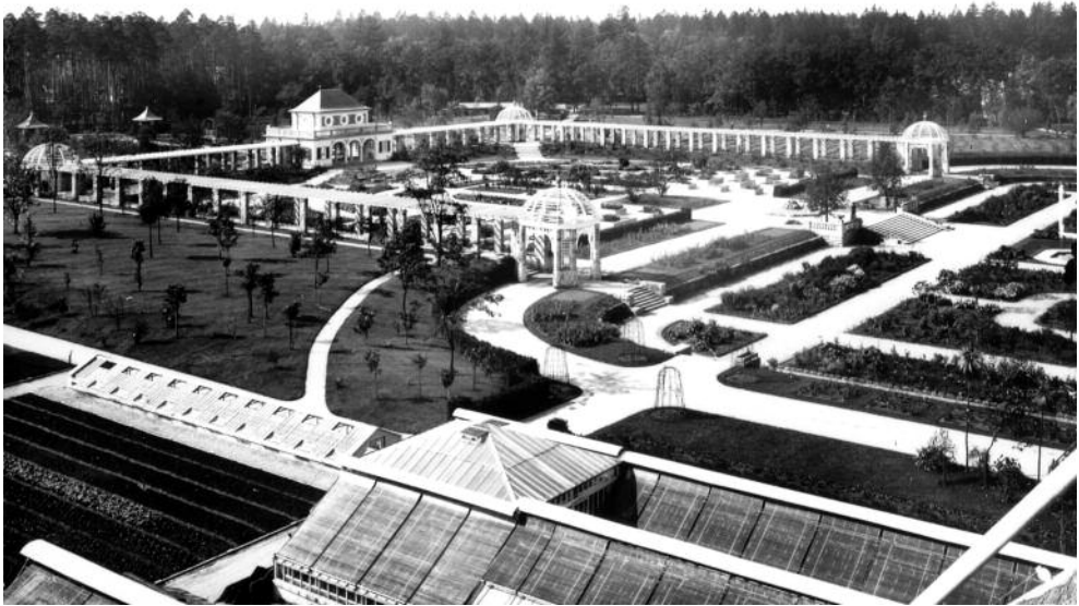
Abb. 3: Luftaufnahme der Pergola des Botanischen Gartens ca. 1919 mit dem ursprünglich als Trinkhalle angelegten späteren Café. Die geschnitzten Ananas-Skulpturen auf den vier Pergola-Dächern, die viele Jahre fehlten, wurden 2014 historisch getreu erneuert.

gehend von Professoren der Botanik geleitet, die natürlich alle zu Lehre und Forschung verpflichtet waren. Auch die enge Verbindung zur Botanischen Staatssammlung – mit ihren rund 3 Millionen getrockneten Pflanzen, Pilzen und Flechten und weit über hundert Gastforscher-aufenthalten pro Jahr – ist für die wissenschaftliche Nutzung des Gartens ideal.